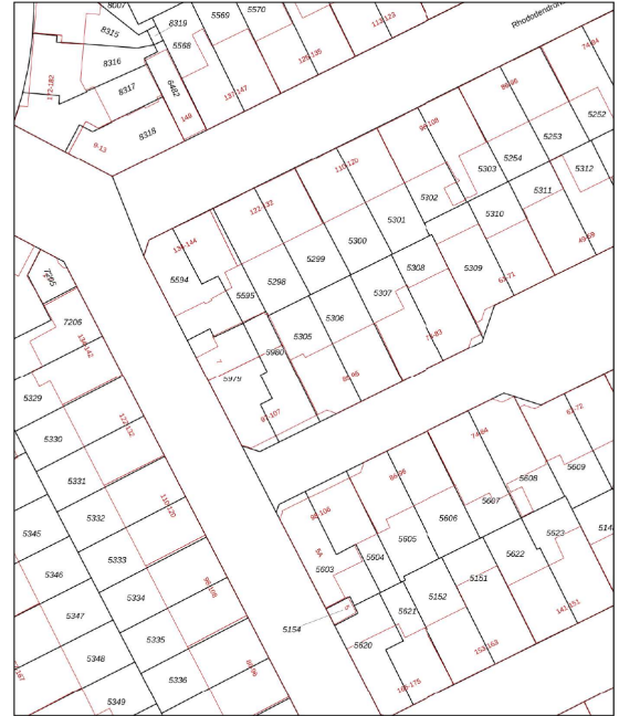
Kadastrale kaart Uw referentie: Spiraea 93

DEZE PLATTEGRONDEN ZIJN MET DE GROOTSTE ZORG SAMENGESTELD EN DIENEN TER INDICATIE. ER KUNNEN GEEN RECHTEN AAN WORDEN ONTLEEND. © WWW.DROOMHUIS360.NL